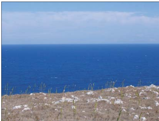
Bari lat= 41.12432, lon=16.866465 , (still da / from video), 2007, installazione ambientale (part.) / environmental installation (detail), mixed media (foto, video, cartografie, registrazioni sonore / photographs, video, cartography, sound recordings), dimensioni variabili / various dimensions