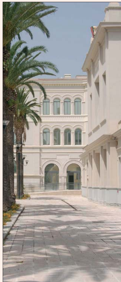
■ Particolare esterno della Biblioteca Nazionale Sagarriga Visconti Volpi / Detail of the exterior of the Sagarriga Visconti Volpi National Library

La nuova sede della Biblioteca Nazionale Sagarriga Visconti Volpi di Bari, da pochi mesi trasferita insieme all'Archivio di Stato nei bellissimi spazi ristrutturati dell'ex Macello comunale, costituisce un esempio alto di riqualificazione di una zona periferica della città, con la nascita di una "Cittadella della cultura" aperta ad incontri multidisciplinari, mostre, concerti. I corridoi e le zone di raccordo tra sale di lettura, accettazione e uffici, rappresentano dunque un interessante location per esporre le tracce installative delle ricerche che i tre giovani artisti hanno condotto sulla città, partendo dal tema Periferie, tra emergenze e recupero , declinato qui con diversi risvolti sociali.