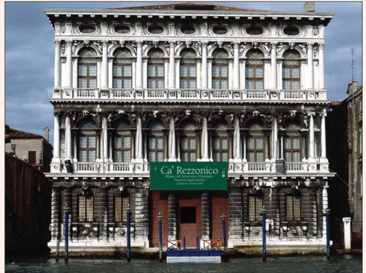
■ Ca' Rezzonico - Museo del Settecento Veneziano / Ca' Rezzonico - Museum of Eighteenth-Century Venice