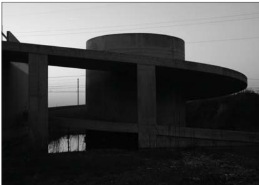
Noi non ci saremo / We won't be there , 2006, fotografia di scena per allestimento video on site / photograph of a scene for on site video installation, dimensioni ambiente / environmental dimensions

Landscape presenta a Ca' Rezzonico il lavoro degli artisti Giacomo Artusi e Pierluigi Carossino , realizzati on site pensando ad una rilettura contemporanea di Mondo Novo di Giandomenico Tiepolo.