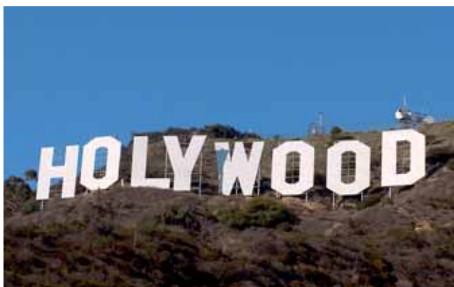
HOLLYWOOD lambda print, 170 x 200 cm, 2009

Vive e lavora a / Lives and works in Trento