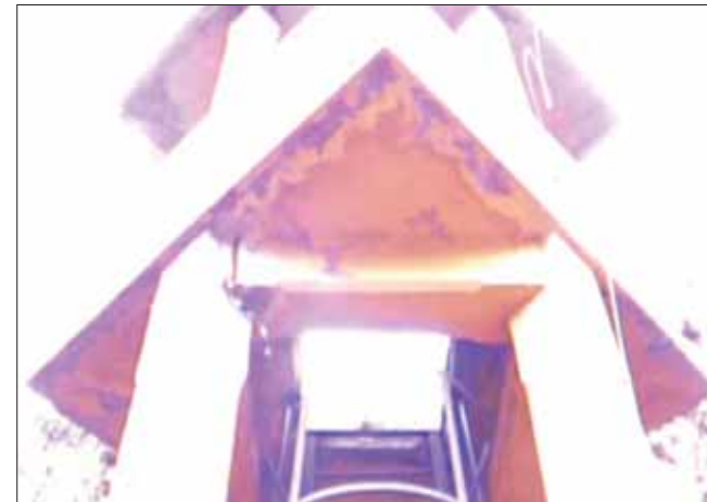
assedio still da video, 2009