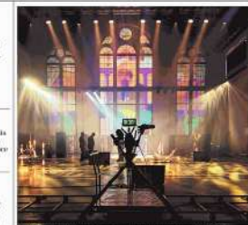
Il momento in cui gli under 35 si incontrano in un tavolo virtuale per discutere del futuro.

10 Le stanze del futuro saranno virtuali.